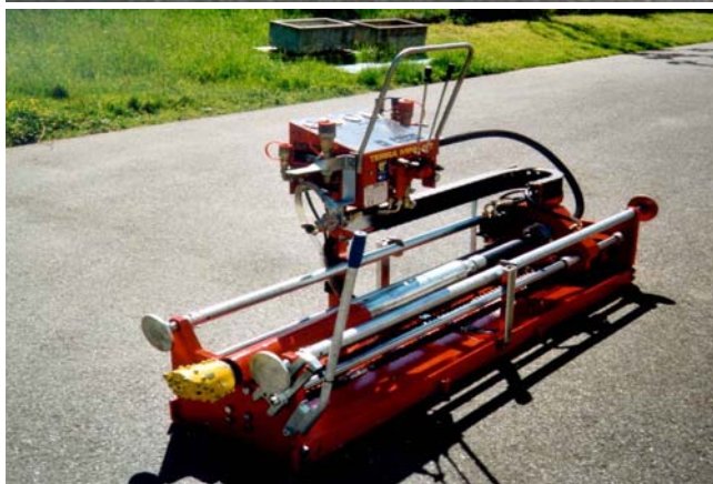
С ударной головкой TERRA-ROCK