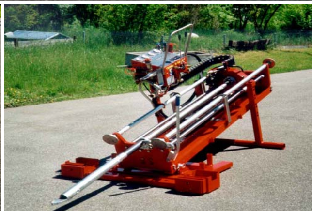
С приспособлением для старта с поверхности